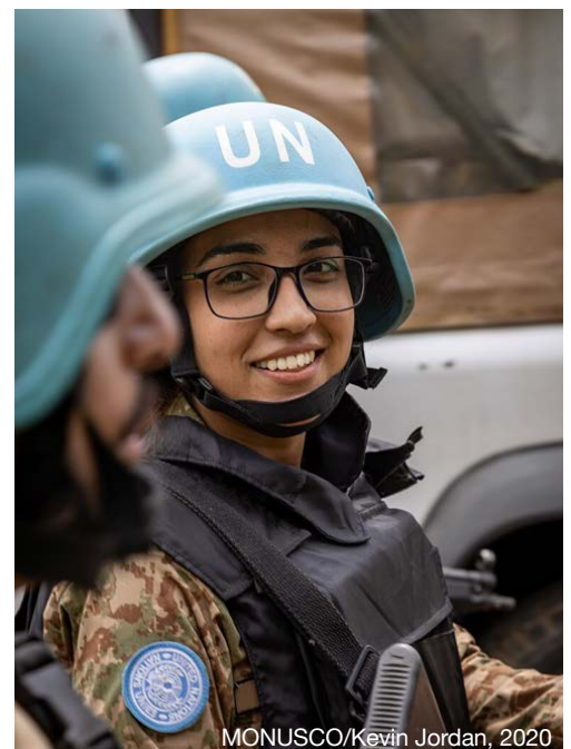
MONUSCO/Kevin Jordan, 2020

Saat ditugaskan, ibu-ibu dapat menghadapi penilaian dan stigma sebagai “ibu yang buruk” dan egois, sementara ibu-ibu yang tidak ditugaskan sering menghadapi bias maternal dan asumsi bahwa mereka kurang berkomitmen dan mampu.